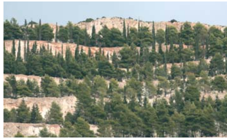
Διαχειριζόμαστε επτά λατομεία κοντά στα εργοστάσια, όπου εξορύσσεται ασβεστόλιθος, άργιλος και σχιστόλιθος, καθώς και τρία λατομεία που λειτουργούν από τη θυγατρική εταιρία ΛΑΒΑ στη Μήλο, το Γυαλί Νισύρου και το Αιτσί Κρήτης.