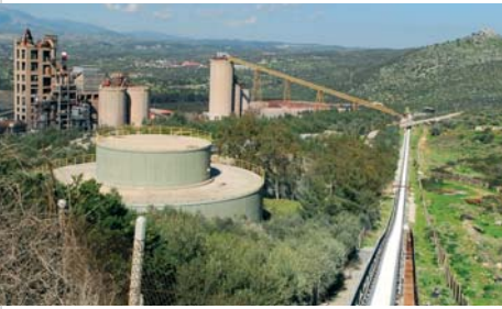
Τρία εργοστάσια παραγωγής τσιμέντου, στο Βόλο, τη Χαλκίδα και το Μηλάκι Εύβοιας, με συνολική παραγωγική δυνατότητα 9,6 εκατ. τόνους ετησίως.