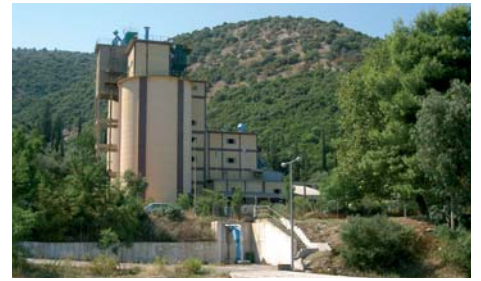
Έξι κέντρα διανομής τσιμέντου σε Θεσσαλονίκη, Δραπετσώνα, Ρίο, Ηράκλειο, Ηγουμενίτσα, Καβάλα που διακινούν 2,5 χιλιάδες τόνους τσιμέντο, το οποίο μεταφέρεται στους πελάτες μας σε όλη την Ελλάδα.